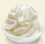
Schlagobers separat |G 1.2

Jedes Eisdessert wird mit einer Packung Manner Eiswaffeln (A|F) ohne Aufpreis serviert.