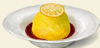
Amalfi Zitrone A|F 12,-

aromatisches Zitroneneis · Zeste · Himbeerspiegel