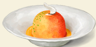
Topfen & Mango A|F|G 12,-

Topfeneis · Mangokern · verfeinert mit Mangopüree · Kokosraspeln